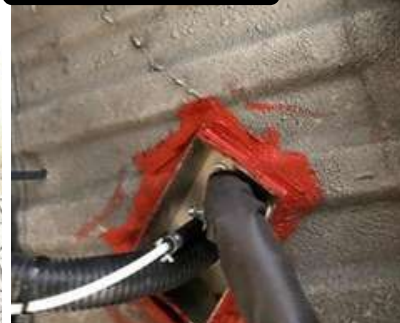
SALIDA DE LAS TUBERÍAS