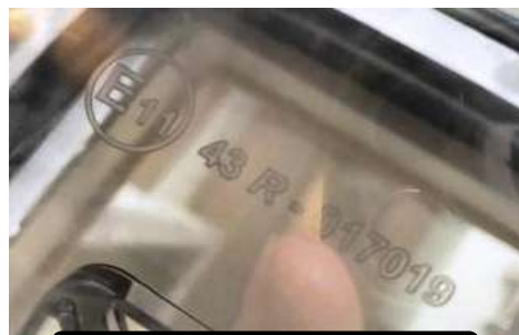
CONTRASEÑA DE HOMOLOGACIÓN

Nota: hay que fotografiar el interior y exterior de todas las claraboyas así como la contraseña de homologación