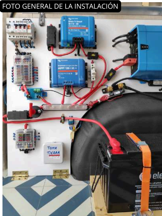
FOTO GENERAL DE LA INSTALACIÓN