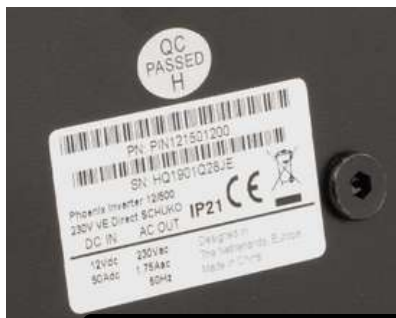
MARCADOS CE DE LOS ELEMENTOS